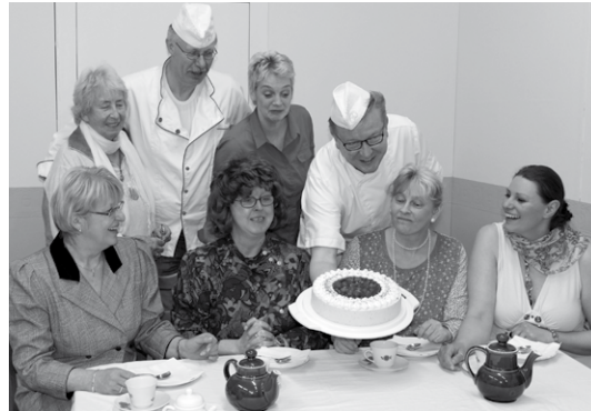
Lustige Runde: Das Ensemble der „Büsumer Theotermoker“