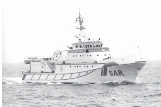
Der auf Helgoland stationierte 46 m-Kreuzer „Hermann Marwede“ ist das Flaggschiff der Gesellschaft