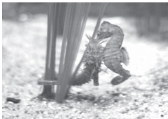
„Der Neue“ nähert sich vorsichtig seinem Artgenossen

Der Neuzugang ist ca. 1 Jahr alt und hat noch keinen Namen bekommen. Der Betreiber der „Büsumer Meereswelten“ will es den jungen Besuchern überlassen, einen geeigneten Namen zu finden. Also, denkt mal scharf nach, ob Euch ein guter Name einfällt.