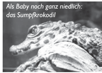
Als Baby noch ganz niedlich: das Stumpfkrokodil

und beeindruckt durch seine besondere Färbung. Dieser Fisch kann 45 cm lang werden und frisst kleine Fische, Krebstiere und Muscheln. Kugelfische sind bekannter weise giftig, denn sie nehmen über ihre natürliche Nahrung Giftstoffe zu sich.