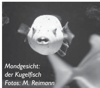
Mondgesicht: der Kugelfisch