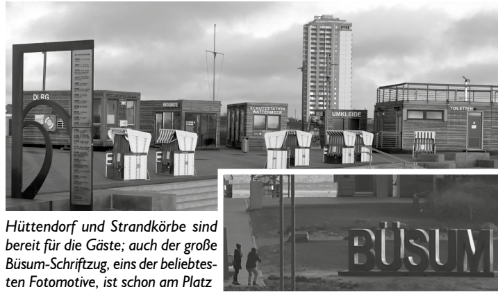
Hüttendorf und Strandkörbe sind bereit für die Gäste; auch der große Büsum-Schriftzug, eins der beliebtesten Fotomotive, ist schon am Platz

Rechtzeitig zum Saisonstart ist auch auf der Watt'n-Insel wieder Leben eingekehrt: Das Budendorf ist weitgehend aufgebaut, erste Strandkörbe stehen bereit und auch die weitere Strandmöblierung wie Duschen, Bänke und Handläufe sind wieder montiert. Auch die Gastronomie freut sich auf Gäste.