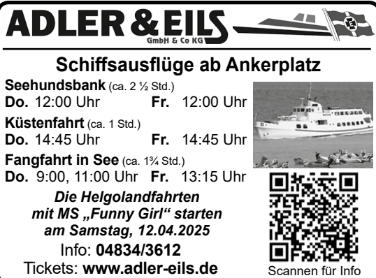
Mit der „Ol Büsum“ zu den Seehundsbänken ...