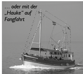
... oder mit der „Hauke“ auf Fangfahrt

Ab Donnerstag kann man von Büsum aus wieder regelmäßig zu verschiedenen Ausflugsfahrten in See stechen. Ob auf der einstündigen Küstenfahrt , der Fahrt zu den Seehundsbänken oder mit dem Kutter Hauke auf Fangfahrt in See , bei der mit einem Krabbennetz im Kleinformat vor Büsum gefischt wird. Diese Fahrten starten alle ab Ankerplatz. Helgoland-Freunde müssen noch ein paar Tage warten: Ab 12. April nimmt die Funny Girl täglich um 9:30 Uhr vom